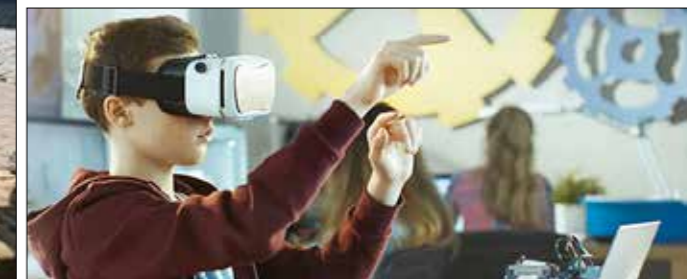
Vervolg blz. 4 >

Erfgoededucatie biedt een manier om naar onze cultuur te kijken. Het is erop gericht leerlingen zintuiglijk te laten ervaren dat de wereld niet uit losse stukjes bestaat, maar uit verbindingen die een geheel vormen. De Erfgoededucatie van het platform Reizen in de Tijd in Midden-Limburg wordt vertegenwoordigd door DOEN! www.doenmiddenlimburg.nl Doen! Midden-Limburg wordt mogelijk gemaakt door het Fonds voor Cultuurparticipatie en de Provincie Limburg.